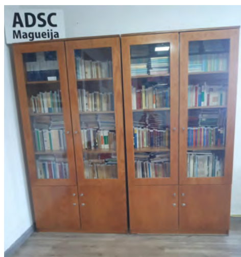
Biblioteca da Associação com todos os livros recenseados

O Torneio de Damas, integrado no programa das festas da Senhora dos Remédios