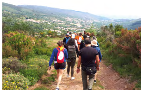
O evento "Reviver da Aldeia"