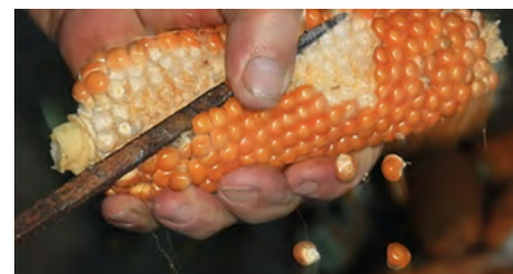
Desfolhada e debulhada do milho