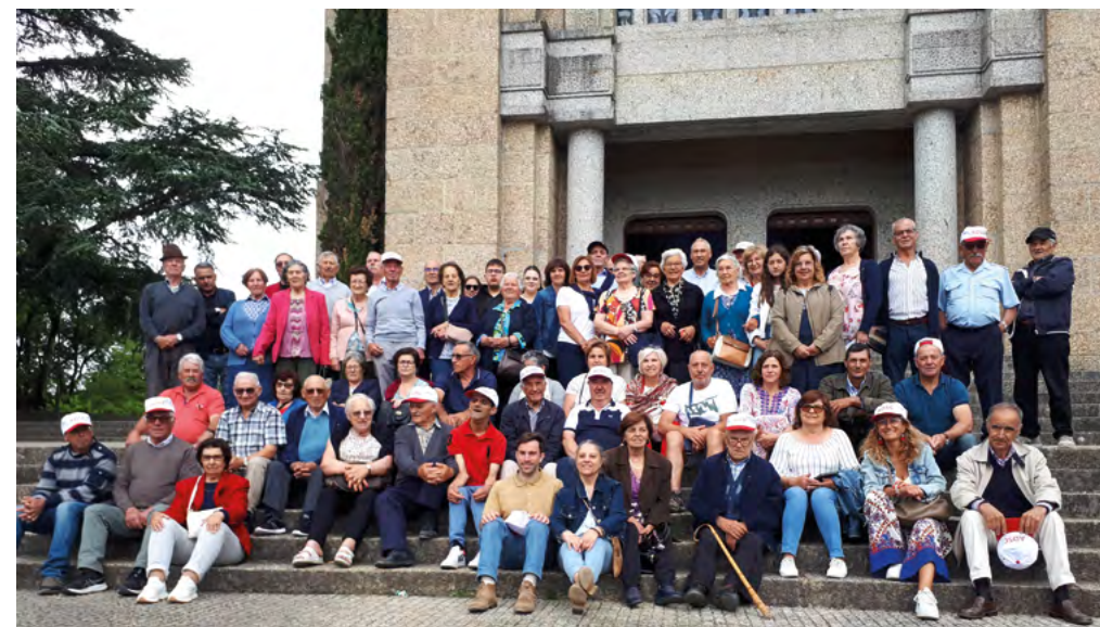
Passeio cultural e recreativo tendo o 1.º como destino Aveiro e outro a Guimarães