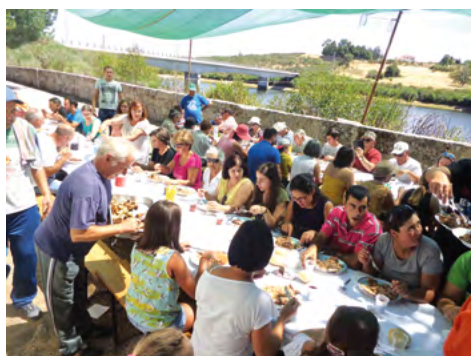
Encontro anual das pessoas de Pretarouca, Bigorne e Dornas