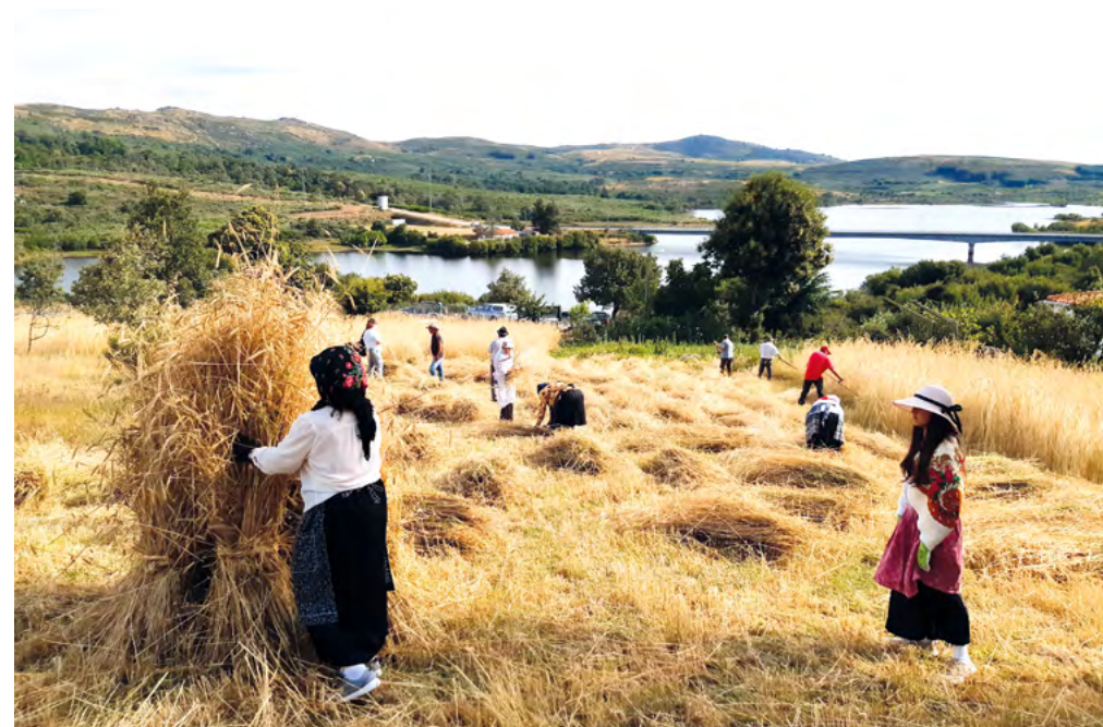
Segada tradicional do centeio

Para preservarmos a nossa identidade e não deixarmos morrer o nosso passado com o objetivo de o dar a conhecer às gerações vindouras, esta Direção no cumprimento do seu Plano Anual de Atividades promove todos os anos os seguintes eventos: