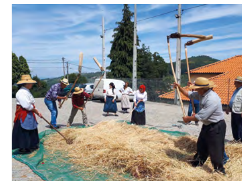
Malhada tradicional do centeio