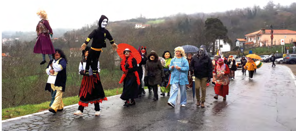
O Cortejo do Entrudo com exibição do compadre e da comadre e leitura dos seus testamentos