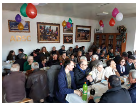
O almoço de aniversário da Associação